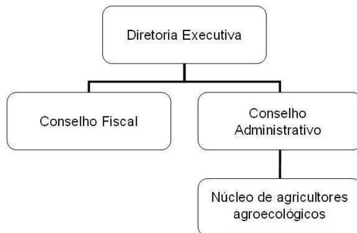
FIGURA 2. Estrutura organizacional da Cooperativa Sul Ecológica