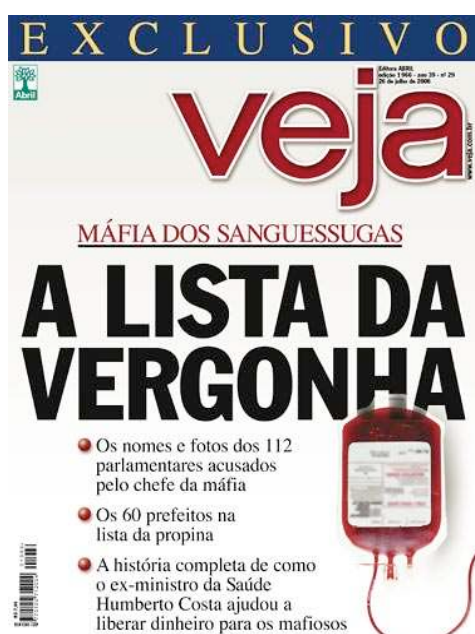
Figura 1. Capa da Revista Veja de 26 de julho de 2006 36

Esta análise, sem desconsiderar a repercussão como um todo, detém-se em uma capa da Revista Veja: