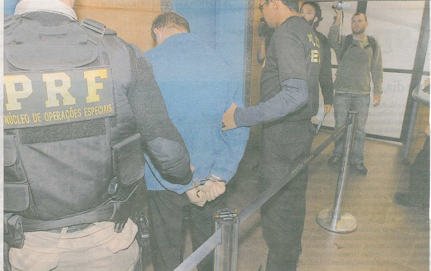
Agentes da PF e da PRF prenderam ontem pela manhã em 11 municípios gaúchos colegas suspeitos de facilitar o contrabando e receber mercadorias como propina

Uma ofensiva da Polícia Federal com apoio da Polícia Rodoviária Federal capturou ontem 20 suspeitos de envolvimento com contrabando de mercadorias do Paraguai para o Estado – 10 deles policiais rodoviários que seriam delatores da fiscalização