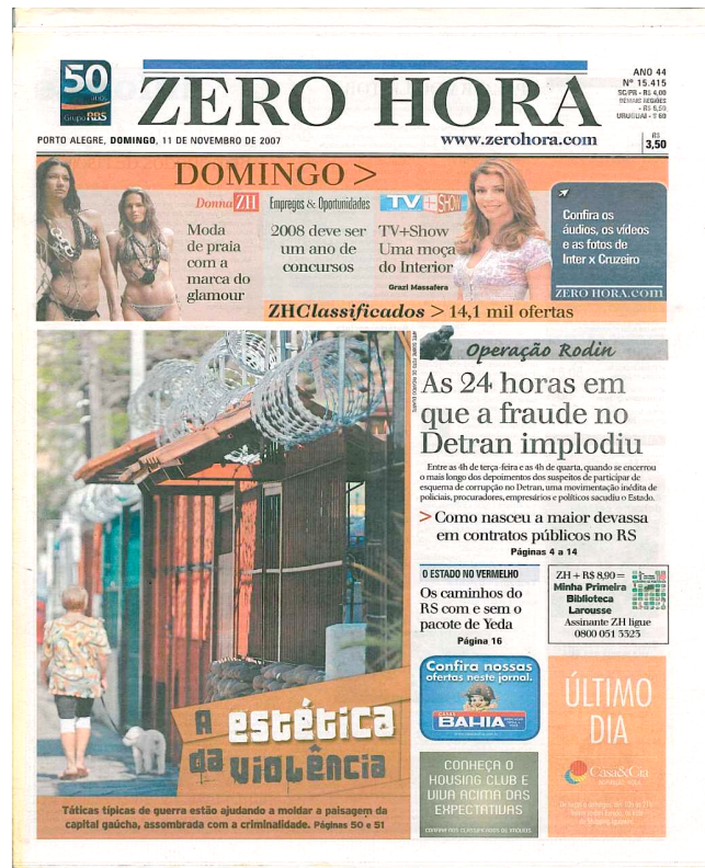
Figuras 5. Primeira página do Jornal Zero Hora de 11 de novembro de 2007

A partir de trabalhos de Rojo (2005; 2007 49 ), pode-se dizer que o gênero primeira página de jornal apresenta características próprias, quais sejam: (a) editoria própria; (b) enunciado completo onde se intercalam outros gêneros; (c) leva em conta os leitores que só lêem primeira página; (d) faz destaques (o que publicar, pensando na apreciação do leitor); (e) apresenta imagens visando a efeitos de sentido; (f) contém manchetes e olhos; (g) aponta “links” – semelhante às notícias da Internet; (h) traz fotolegendas que constroem sentidos; (i) o conjunto desses elementos compõe uma leitura verbo-visual.