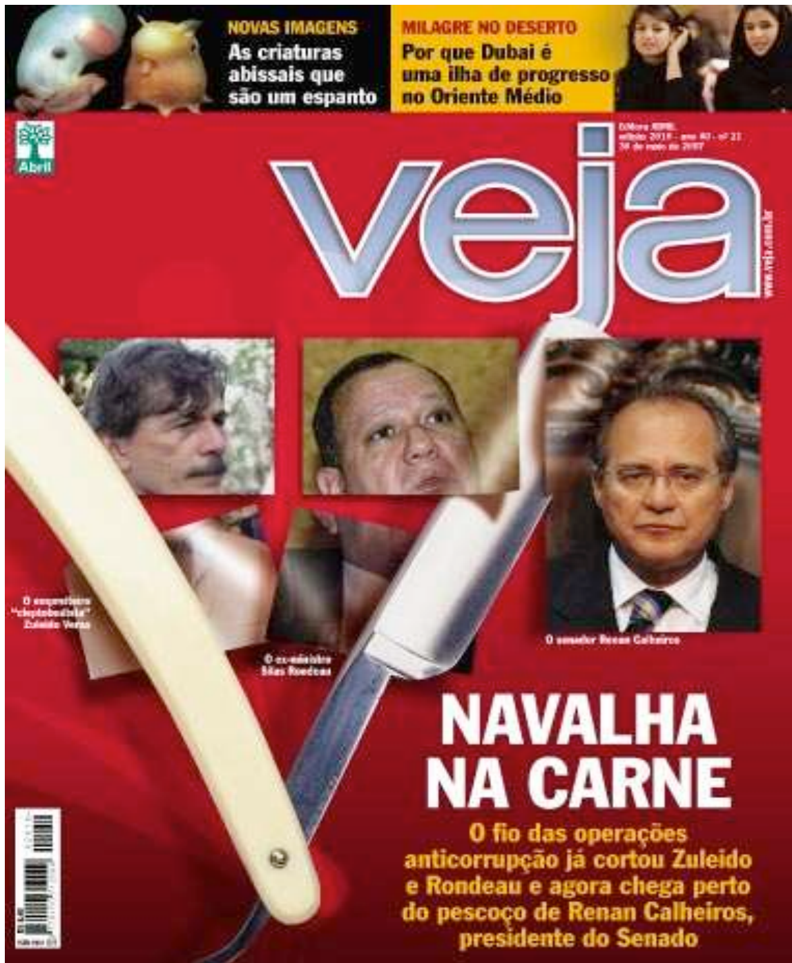
ANEXO G – Capa da revista Veja de 30 de maio de 2007