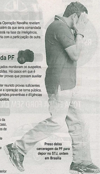
Preso deixa carceragem da PF para depor no STJ, ontem em Brasília

Farol da Colina — remessa ilegal de dinheiro para o Exterior