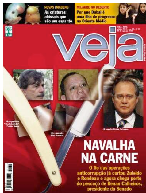
Figura 4. Capa da Revista Veja de 30 de maio de 2007

A seguir, é analisada a capa da revista Veja do dia 30 de maio de 2007 em que a Operação Navalha é o centro da atenção: