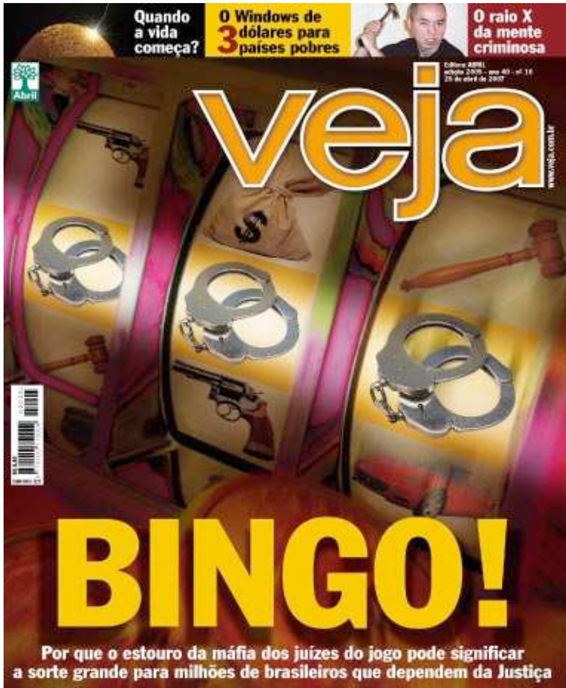
ANEXO D – Capa da Revista Veja de 27 de abril de 2007