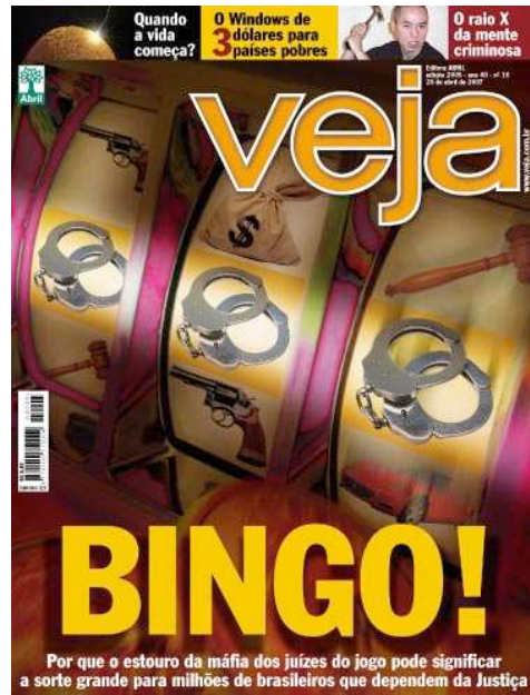
Figura 3. Capa da Revista Veja de 25 de abril de 2007

Levando em conta a grande repercussão da Operação na mídia, é analisada a capa da Revista Veja do dia 25 de abril de 2007: