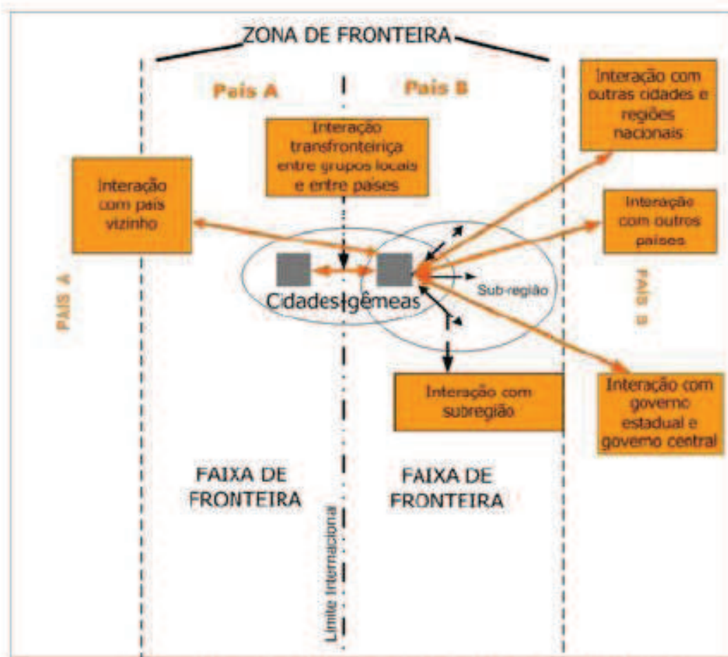
Figura 1 – Panorama da Fronteira