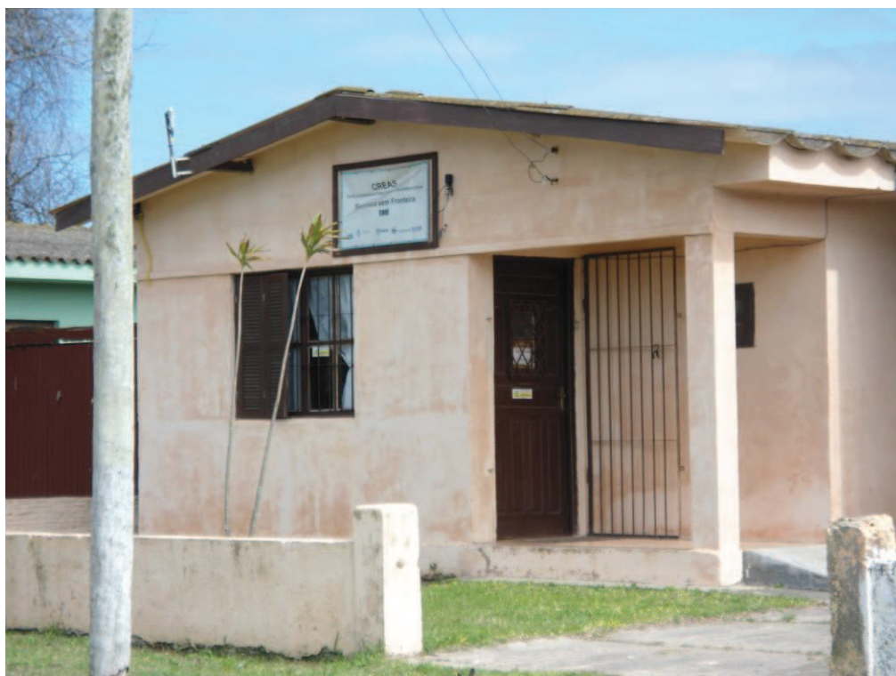
Fonte: Pesquisa de campo 2012. CREAS Sentinela das Fronteiras.