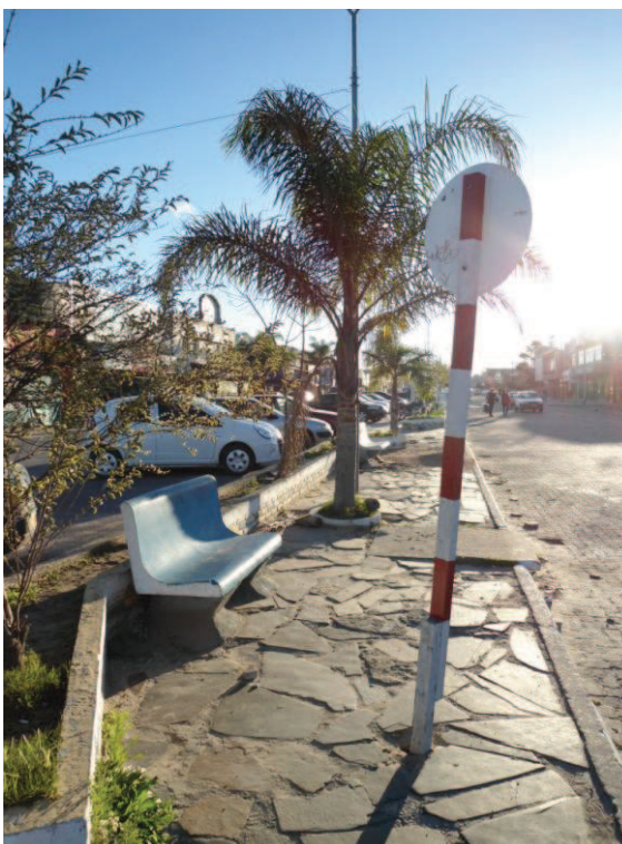
Fonte: Pesquisa de campo 2012. Fronteira Brasil/Uruguai. Avenida principal entre Chuí/BR e Chuy/UY.