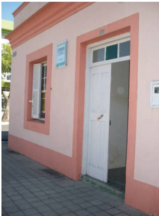
Fonte: Pesquisa de campo 2012. Imagem cedida pela equipe técnica. CREAS Jaguarão.