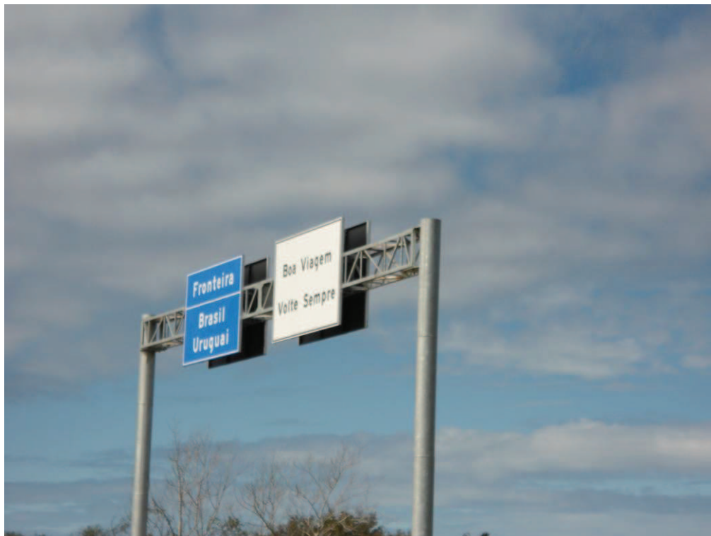
Placas da divisa fronteiriça entre Brasil e Uruguai – imagem registrada da frente do CRAS e do CREAS.