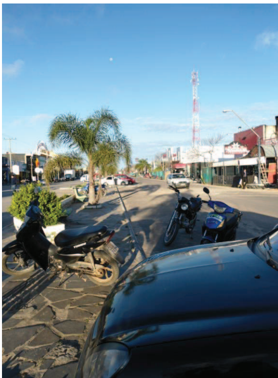
Fronteira Brasil/Uruguai. Avenida principal entre Chuí/BR e Chuy/UY.