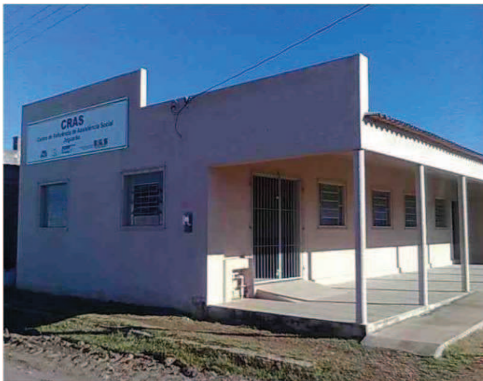
Fonte: Pesquisa de campo 2012. Imagem cedida pela equipe técnica CRAS Jaguarão.