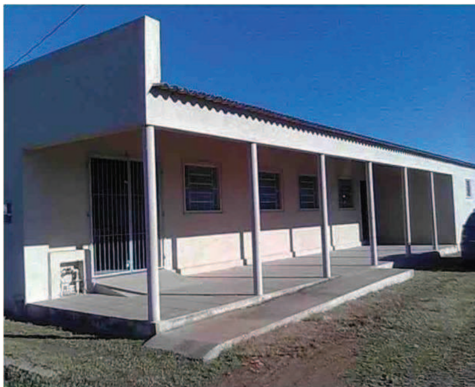
Fonte: Pesquisa de campo 2012. Imagem cedida pela equipe técnica CRAS Jaguarão.