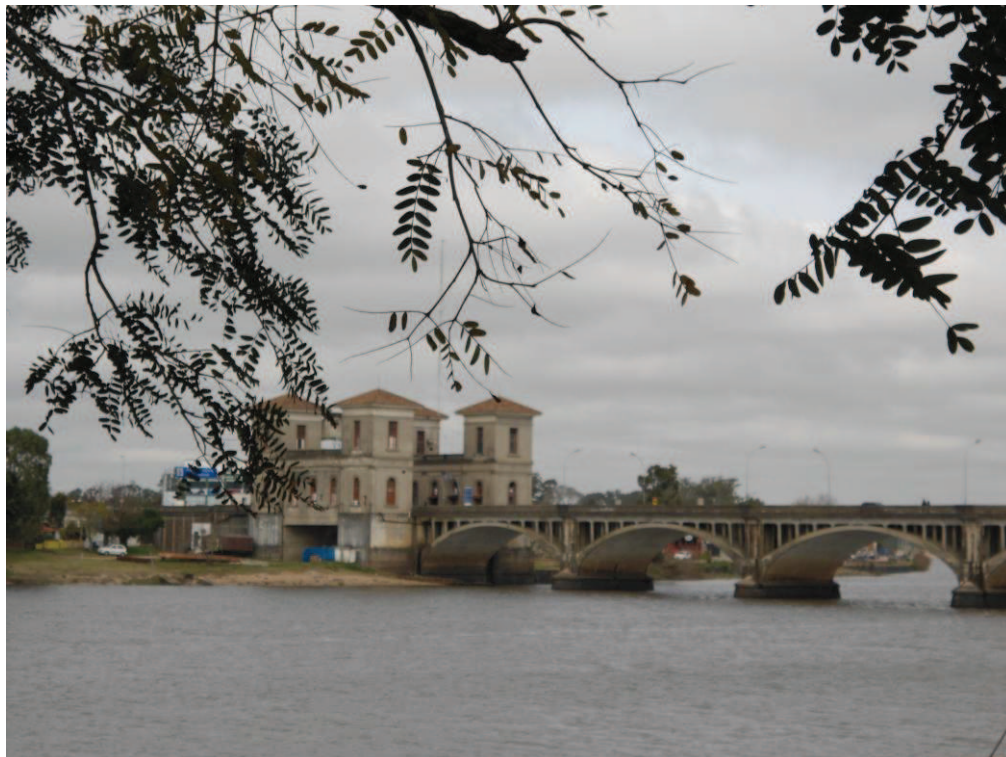
Fronteira Brasil/Uruguai. Ponte Internacional Barão de Mauá entre Jaguarão/BR e Rio Branco/UY. Imagem registrada da frente da Secretaria de Cidadania e de Direitos Humanos de Jaguarão.