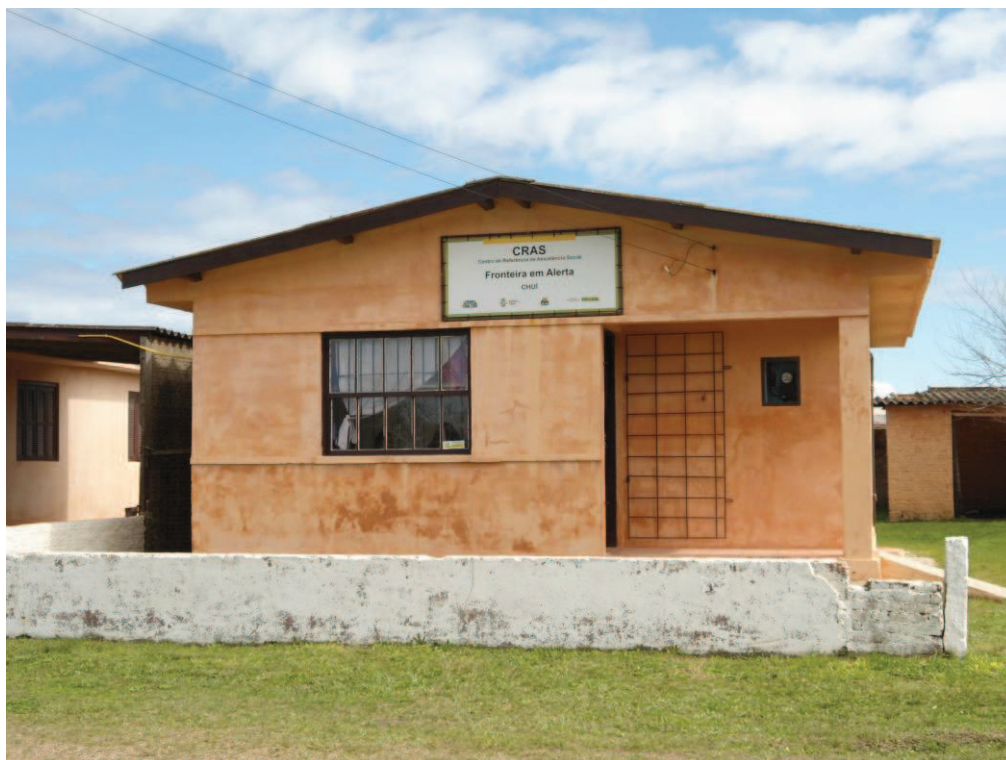
Fonte: Pesquisa de campo 2012. CRAS Fronteiras em Alerta e CREAS Sentinela das Fronteiras.