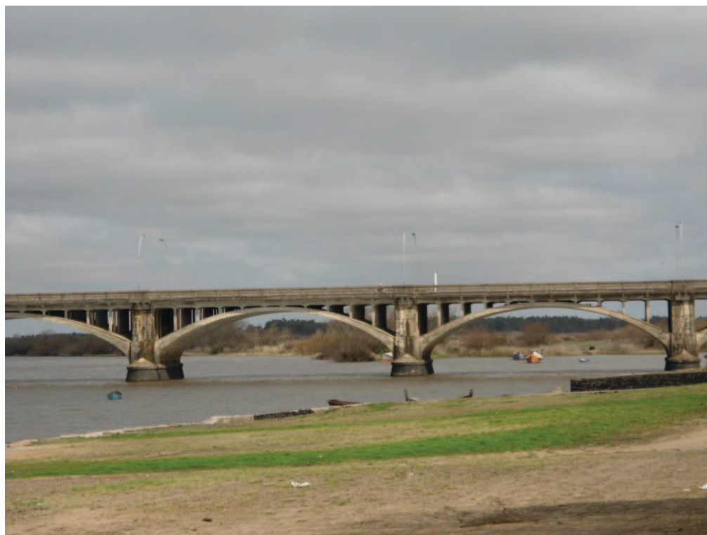
Fronteira Brasil/Uruguai. Ponte Internacional Barão de Mauá entre Jaguarão/BR e Rio Branco/UY.